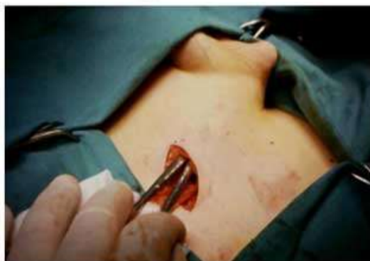
Viene creata la strada attraverso la quale il testicolo raggiungerà la borsa scrotale (freccia)