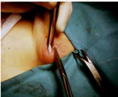
Fissazione del testicolo ai tessuti dello scroto