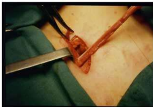
Spesso è associato un dotto erniario (freccia) che viene isolato e legato