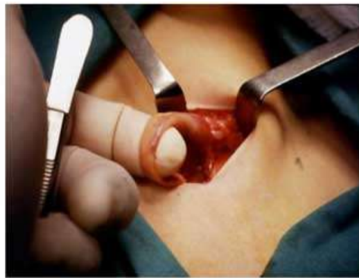
Isolamento del testicolo e del suo funicolo (nella foto caricato sotto il dito del chirurgo)