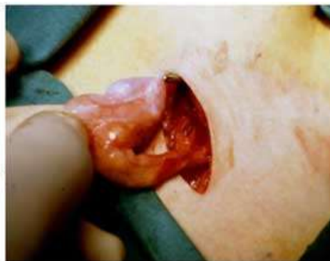
Il testicolo viene preso con uno strumento e portato nella sua sede scrotale