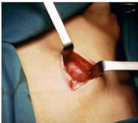
Attraverso un'incisione inguinale si raggiunge il testicolo

Nei casi più complessi (rari), in cui il testicolo sia molto distante dallo scroto, può essere necessario ricorrere a tecniche chirurgiche più complesse o a più interventi chirurgici.